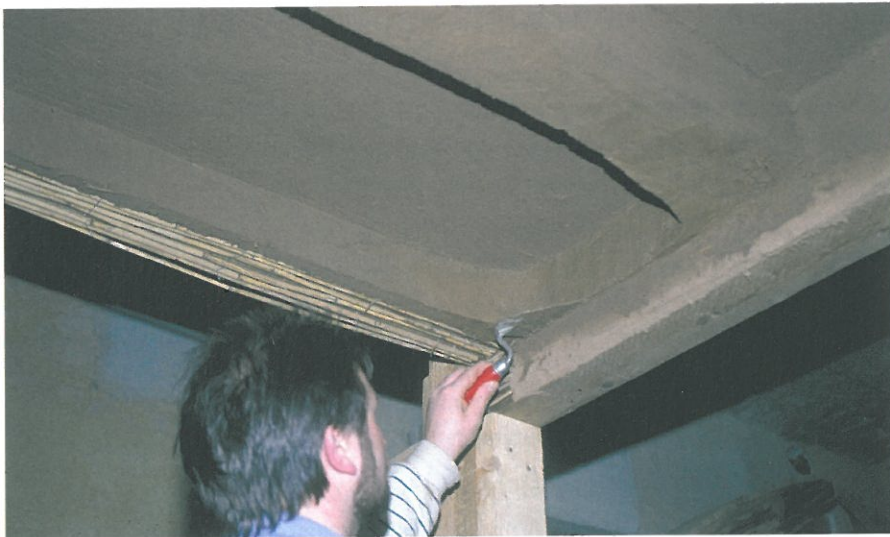
Abb. 10.84: Plastisches Arbeiten an der „Kölner Decke“

Sie entwickelten sich mehr und mehr zu eigenständigen Zierformen, die über Jahrhunderte hinweg den Innenraumcharakter ganzer Regionen prägten. Als Beispiel sei die im gesamten Rheinland verbreitete „Kölner Decke“ genannt, die ihrer Bezeichnung nach dem Ideal der städtischen Wohnform entsprach (Abbildung 10.84).