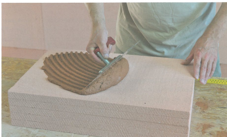
Abb. 7.9: Aufziehen von Lehmklebemörtel auf Mineralschaum- dämmplatten