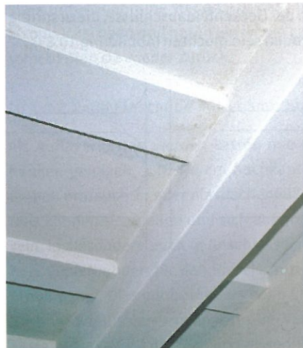
Abb. 10.86: Deckenuntersicht der „Kölner Decke“ mit Profil in 2/3 Balken- höhe und Viertelkreis- abschluss