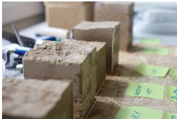
Grounded Materials.