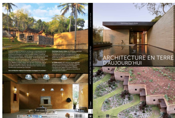
TERRA Award, „Lehmarchitektur Heute“; vdf Hochschulverlag an der ETH Zürich.