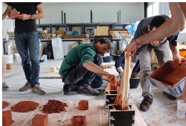
Grounded Materials.