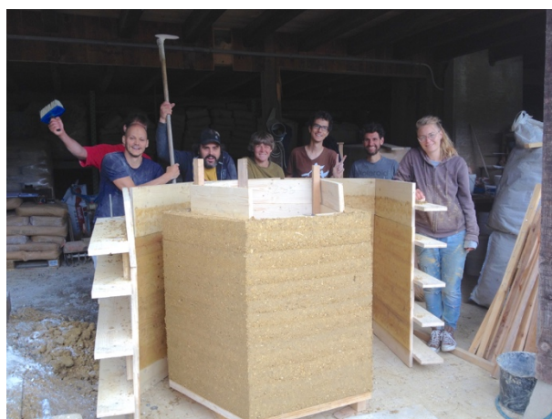
Think Earth! Workshop (Seewen)