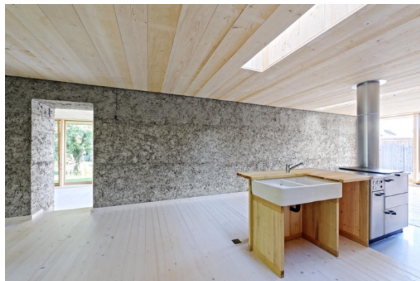
Spaceshop Architekten (Haus Flury, Deitingen)