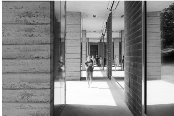
Boltshauser Architekten (Schule Allenmoos, Zürich)

Das Ausstellungsmobiliar von Think Earth! wurde im Rahmen eines fünftägigen Workshops von Freiwilligen erstellt. Dieser Bereich der Ausstellung gibt einen Einblick in den Entstehungsprozess des Pavillons, der Stampflehmtürme und der „Brickbar“. Gezeigt werden auch die speziell für die Stampflehmelemente konzipierte Schalung.