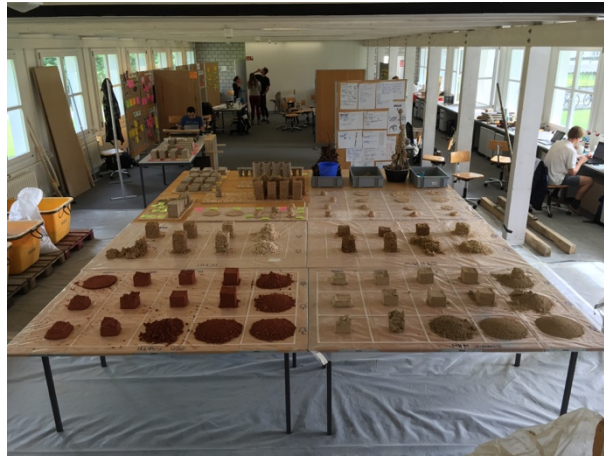
Grounded Materials.