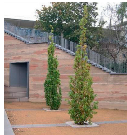
Naturbelassener Lehmputz (Firma Pisosith); Bocklitz Wandersleben; Himmelsleiter, Nordhausen (Lehmstoffe Thilo Schneider) Interior with clay plaster (Pilosith); Bocklitz Wandersleben, “Himmelsleiter” staircase, Nordhausen (Lehmstoffe Thilo Schneider)